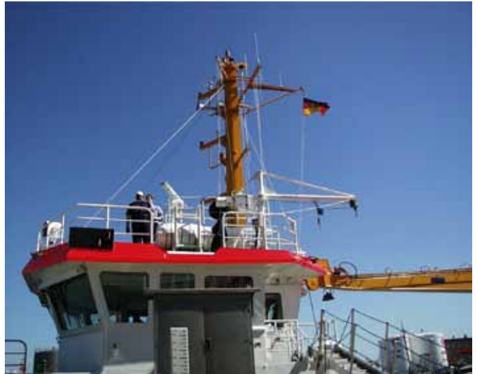
Vermessungsschiff mit SAPOS®-HEPS